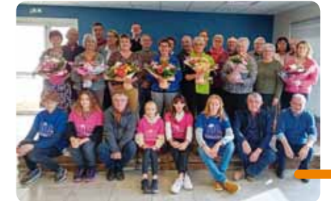
Les membres de l'association célébrant les 45 ans du Bouquet Salaïe.

L'événement important tous les ans c'est notre traditionnelle noce maraîchine avec toujours le même succès depuis 1990. Retenez la date pour 2024 ce sera le dimanche 21 avril à 12h . La billetterie ouvrira au 15 janvier et il faudra faire vite.