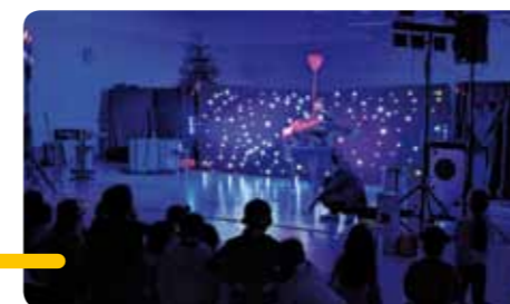
Juminiman and Co en action devant les enfants scolarisés dans la commune.