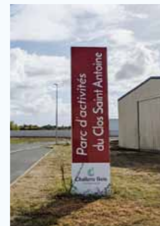
Zone du Clos St Antoine en cours de développement