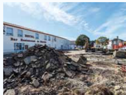
Travaux d'aménagement du centre-bourg