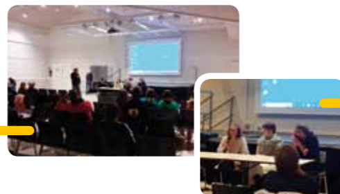
Projection du film suivie d'interventions de nutritionnistes et d'un débat dans la Salle polyvalente.

Après la diffusion du documentaire « Sugarland » réalisé par Damon Gameau, deux nutritionnistes sont intervenus pour débattre autour de ce sujet de société.