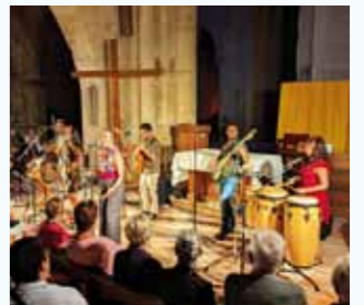
Bike & Run - Mars 2023