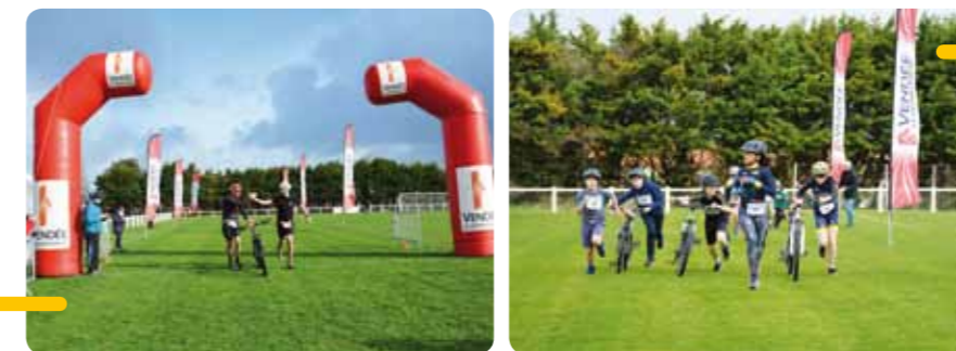
Des participants adultes et enfants lors de la l'édition 2023 du Bike & Run - Pays du Gois.

Programme des courses et inscriptions disponibles prochainement.