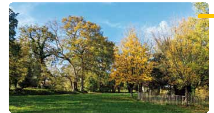
Les arbres au Parc du Cornoir avec leurs habits d'automne.

Les participants sont partis ravis de cette sortie nature, offrant un nouveau regard sur le rôle des arbres en ville, avec des végétaux arborant leurs belles teintes automnales.