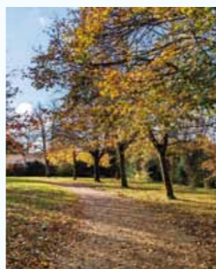
Balade fleurie et balade arborée, organisées en 2023