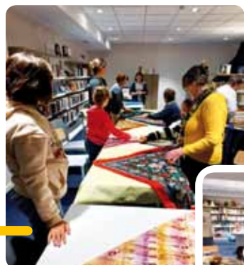
Des participants à l'atelier en train d'apprendre et de pratiquer le Furoshiki.

Cette technique de pliage de tissu, d'origine japonaise, est utilisée notamment pour emballer les cadeaux. Elle offre la possibilité aux personnes utilisant cette technique de réutiliser le tissu et ainsi limiter ses déchets.