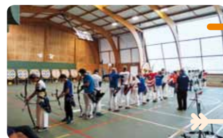
Concours en salle, à St Gervais.