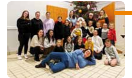
Des membres de l'association Océane Twirling

Pour de plus amples renseignements sur la discipline sportive, contactez Sandrine HUCHET au 06 48 17 32 48