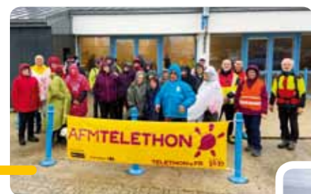
Des participants à la balade pédestre (à gauche), le stand de la vente de livre proposé par la Bibliothèque - Ludothèque « Le 3 » (à droite).

Le Téléthon, à Beauvoir sur Mer, a commencé le 20 octobre dernier par l'action de la Bibliothèque - Ludothèque « Le 3 » avec la vente de livres. Il s'est ensuite poursuivi avec « la course ou marche à votre guise » qui a débuté à partir du 25 novembre, proposant deux circuits de 5,5 et 9,5 km à travers la commune.