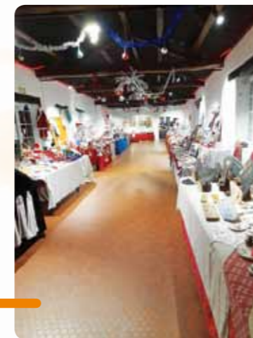
Disposition des stands lors du Marché de Noël organisé par Ambreline à l'Ardoise Verte.