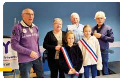
Remise de chèque à l'Association Valentin Haüy en présence d'élus du CME.

Cette action s'est faite en faveur de l'Association Valentin Haüy, qui œuvre en faveur des aveugles et malvoyants.