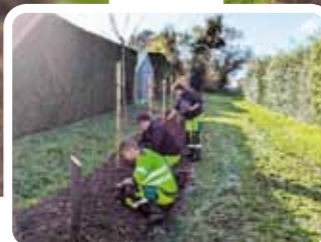
Les services techniques municipaux ainsi que les familles ont répondu présents pour cette belle initiative.