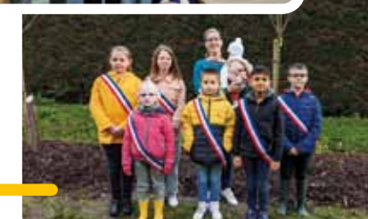
Les élus du CME lors de la Dictée du « Certif » (en haut) et lors de l'opération « 1 naissance 1 arbre » (en bas).