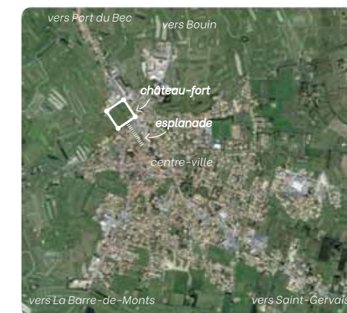
Emplacement estimé du château sur un fond de carte actuel. (2)