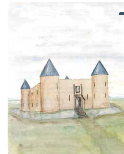
Le château de Beauvoir sur Mer tel que l'on peut l'imaginer d'après la carte de Clerville. (1)