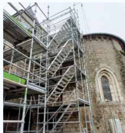
Réalisation de travaux à l'Église Saint-Philbert