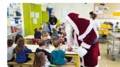
Distribution de chocolats par le Père Noël au restaurant scolaire.

Surprise du chef, le Père Noël a rendu visite aux enfants en fin de repas et leur a remis des chocolats pour leur plus grand bonheur.