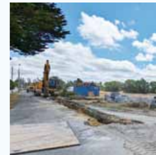
Lotissement communal en cours de viabilisation