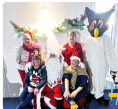
Le Père Noël et la mascotte Asio étaient présents pour cette animation.

Accompagnés du Père Noël, les bénévoles se sont mobilisés pour raconter aux enfants de 3 à 9 ans de belles histoires et permettre ainsi de se plonger dans l'ambiance avant le grand jour.