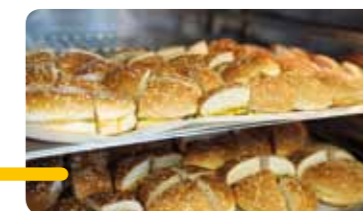
Les cheeseburgers en préparations.