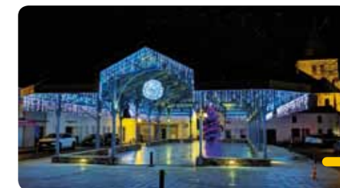
Les services techniques municipaux à pied d'œuvre pour installer les nombreuses illuminations.