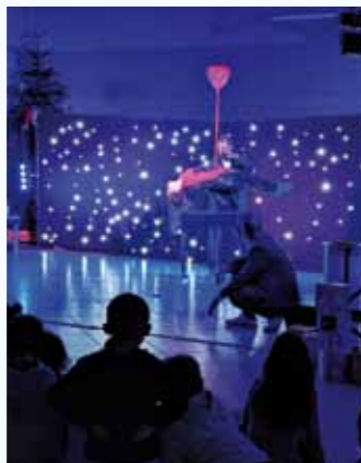
La rentrée scolaire en septembre 2023