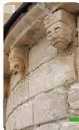
Vitrail récemment recréé (à gauche) et détail de modillons (à droite).