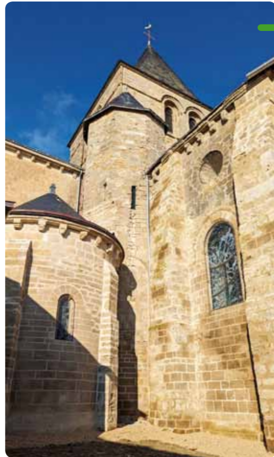
Vue extérieure de la Chapelle St Goustan fraîchement rénovée.

En parallèle, d'autres travaux mineurs sont en cours. La réparation de la voûte du chœur devrait se terminer début 2024. L'échafaudage central pourra ainsi être démonté. De même, par suite de la constatation d'infiltrations importantes au niveau du transept Sud, des interventions sur sa couverture et sur les abatsons du clocher sont prévus également début 2024.