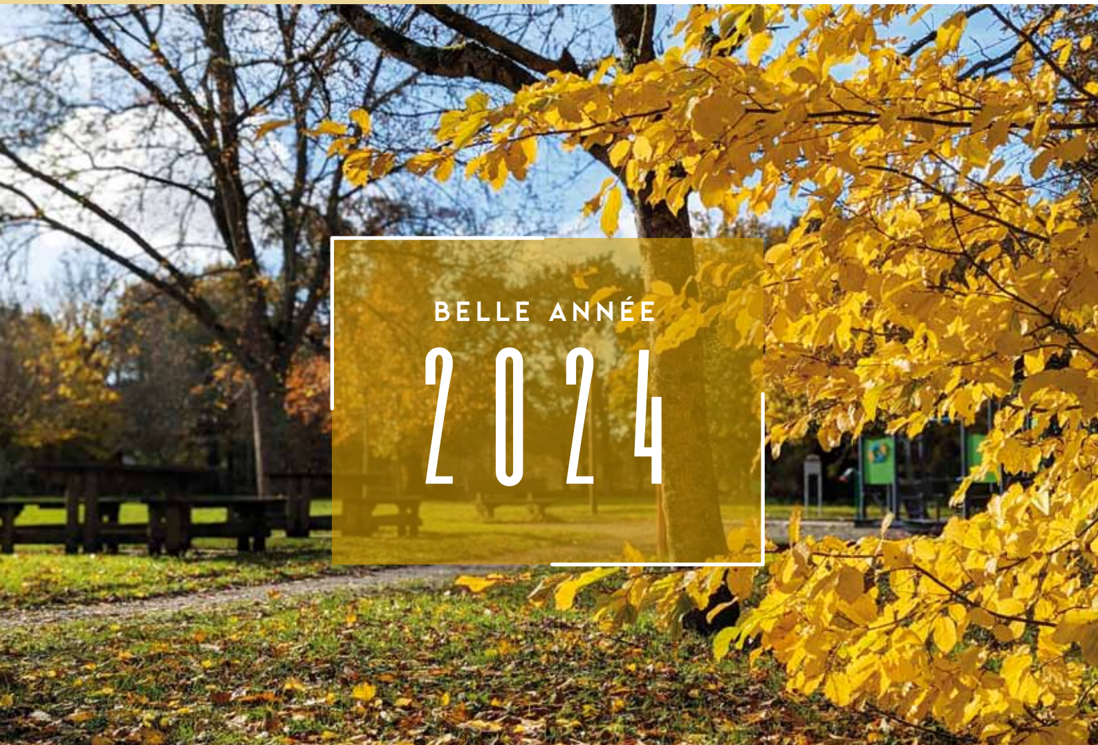
Le Parc du Cornoir sous ses habits d'automne