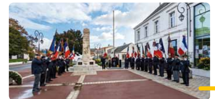
Cérémonie commémorative au Monument aux Morts.

Le mardi 5 décembre, le monument aux morts a accueilli une nouvelle cérémonie à l'occasion de la journée nationale d'hommage aux Morts pour la France pendant la guerre d'Algérie et les combats du Maroc et de la Tunisie .